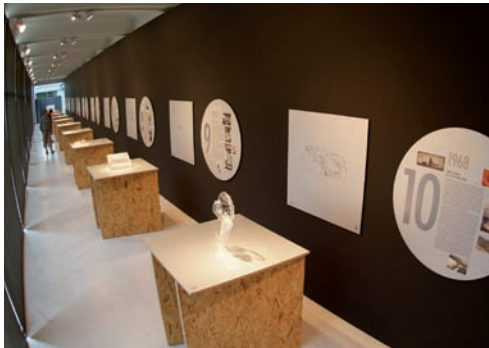
Exposición Los Ángeles, 10 paradigmas , Museo bellas artes de Bilbao

La exposición da una visión sintética de la obra y trayectoria de Rafael Aburto, mediante la exhibición de documentos originales y/o reproducciones gráficas, material audiovisual, textos u otros formatos.