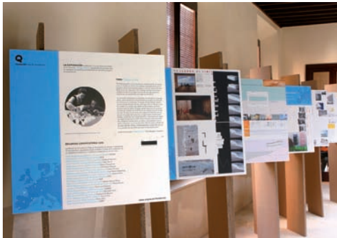
Exposición Becas 2006 , Sede Colegial de Granada