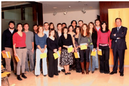
Becarios 2006 con el Presidente de la Fundación.