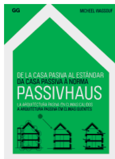
Micheel Wassouf Passivhaus Gustavo Gili, Barcelona, 2014 143 páginas; 22 euros

BUILT FOR THE International Exposition of Modern Industrial and Decorative Arts , held in Paris in 1925, the L'Esprit Nouveau pavilion may symbolize the birth of 'modern' architecture. L'Art décoratif d'aujourd'hui could be the printed expression of the principles inspiring that building. With his sensitivity for the problems of his time and his rhetoric and graphic skills, Le Corbusier analyzes what was then 'decorative art' and is now 'design', criticizing the style that would come of that exhibition ( Art Déco ) from an angle owing to Loos's arguments and the Werkbund's disputes. This publication is the first Spanish version of the classic, now presented in a quasi-facsimile edition.