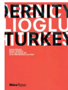
Tabanlıoğlu Architects Modernity in Turkey Skira Rizzoli, Nueva York, 2014 240 páginas; 85 dólares

THE CAJA DE ARQUITECTOS Foundation brings back this classic by a pioneer of urban history as a discipline. Conceiving the city of organic form as a "collective human being," Poëte takes history from the present, as part of a broader corpus and with scientific ambitions that serve to lay the foundations for proposals. Of the two parts of the discourse, the more interesting one is the first, which examines ancient cities through image and drawing, geographical framework, specific site, or evolution of the place, all in the light of the socio-historical context. Poëte's purpose is to find the "general laws of urban order" with which to "solve the problems posed by contemporary urban planning."