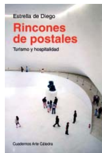
Estrella de Diego Rincones de postales Cátedra, Madrid, 2014 217 páginas; 15 euros

Paisajes conservados 'in vitro', museos abarrotados, monumentos iluminados con colores estridentes, barrios enteros convertidos al 'typicalismo'... todos los ámbitos de la realidad se adoban adecuadamente para no defraudar las expectativas del turista, que son hoy la vara de medir de lo que, quizá sin saber a qué nos referimos, denominamos 'cultura'. Desde la perspectiva de la historia del arte, Rincones de postales parte de la constatación de que el turismo se ha convertido en uno de los procesos más característicos del mundo contemporáneo, y desvela las paradojas propias del fenómeno para terminar proponiendo cambiar el 'turismo' por la 'hospitalidad' en el sentido que le da al término Derrida, quien entiende que la pregunta del viajero, del 'extranjero', lejos de convalidarlo, pone en tela de juicio el orden establecido.