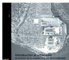
Marcel Poëte Introducción al urbanismo F. Caja Arquitectos, Barcelona, 2011 317 páginas; 39 euros

"YOUR HOUSE IS your larger body." Kahlil Gibran's words serve as frontispiece for a book that unravels the strategies associated with Passivhaus, the German standard for passive construction. Conceiving the city of organic form as a "collective human being," Poëte takes history from the present, as part of a broader corpus and with scientific ambitions that serve to lay the foundations for proposals. Of the two parts of the discourse, the more interesting one is the first, which examines ancient cities through image and drawing, geographical framework, specific site, or evolution of the place, all in the light of the socio-historical context. Poëte's purpose is to find the "general laws of urban order" with which to "solve the problems posed by contemporary urban planning."